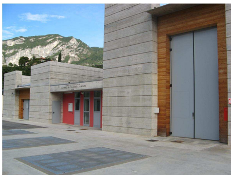
Centrale a Biomassa della Fondazione E. Mach